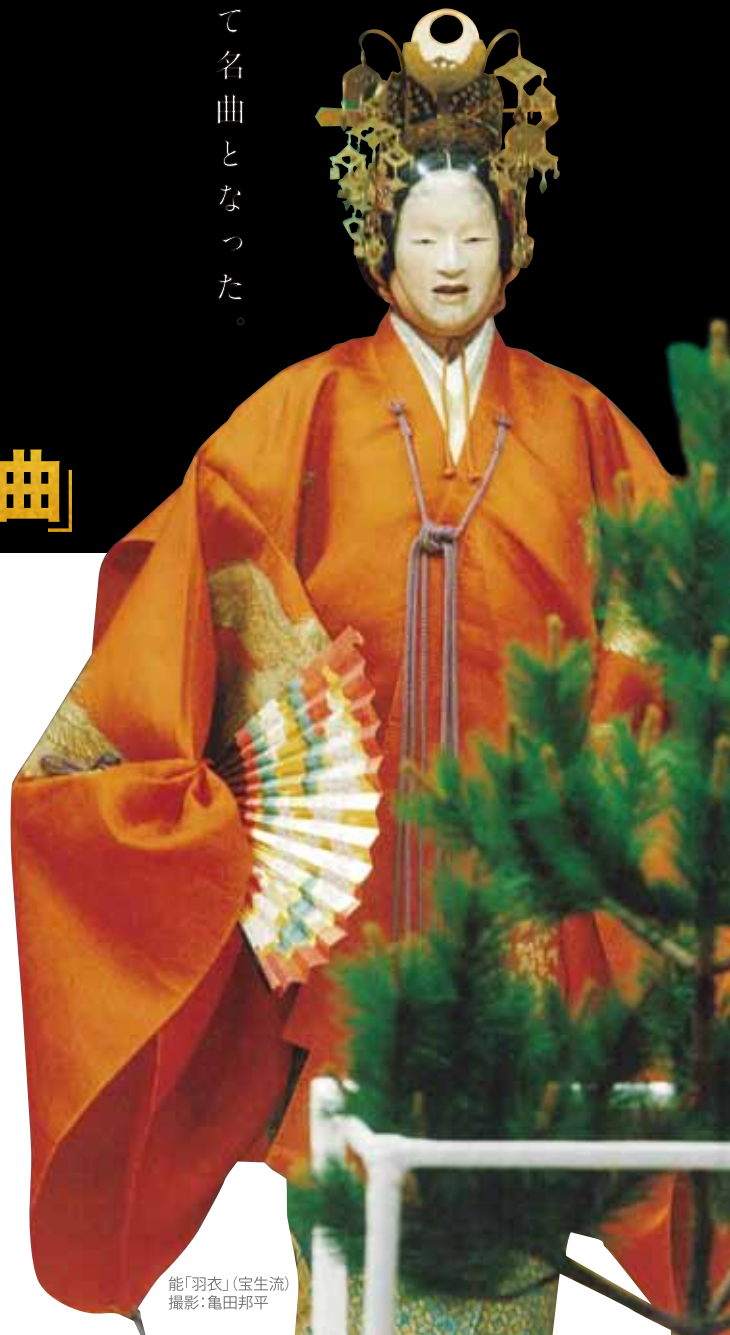
能「羽衣」(宝生流)

主催>横浜能楽堂(公益財団法人横浜市芸術文化振興財団) 助成>文化庁文化芸術振興費補助金(劇場・音楽堂等機能強化推進事業) 独立行政法人日本芸術文化振興会