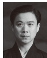
味方玄 (みかたしずか)

シテ方観世流。1966年生まれ。父・味方健および片山幽雪に師事。海外公演にも多数参加。2003年新作能「待月」を初演。著書に「能へのいざない」(淡交社)。2001年京都市芸術新人賞、2004年京都府文化奨励賞受賞。重要無形文化財総合指定保持者。