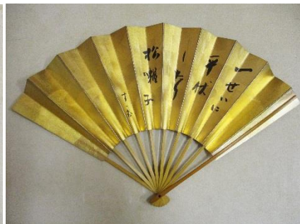
仕舞扇 高橋進句 高橋章氏所蔵