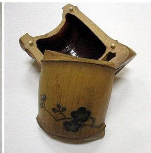
初代萩岡松韻使用の 爪箱 四代萩岡松韻氏所蔵